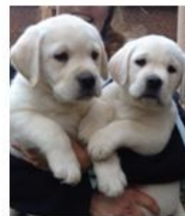
Neo en Newpi