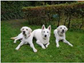
Néo, Nala, Newpi

Neo, Newpi, Ness, Neige, Nala, Otello en Oreo werden medisch goedgekeurd en zijn aan hun opleiding begonnen. Over hen meer nieuws in onze volgende newsletter.