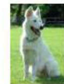
Koban « la classe » chien guide