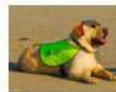
Lewis le choucou, réformé adopté par des connaissances