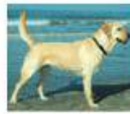
Dinky la gourmande, chien guide retraité