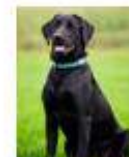
Marley le meilleur, chien d'assistance