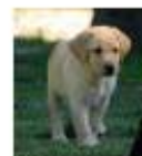
Nina la maligne, chien guía