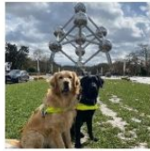
UDJI & UTZI