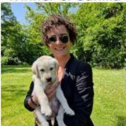
Whisky & Aurore