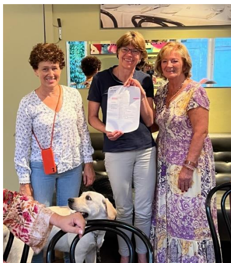
Lions Club Brussels Bruocsella

Merci aussi pour vos différents dons qui ont participé au financement de notre nouvelle camionnette !