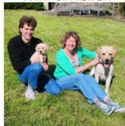
Wolf & Joke

Un grand merci à toutes nos familles d'accueil qui ont accueilli ces chiots et à nos instructrices ! Sans elles, nous ne pourrions former de futurs chiens guides. Nos chiots leur promettent bien du plaisir !