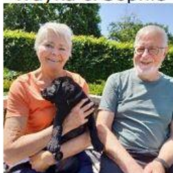
Whisper & Griet