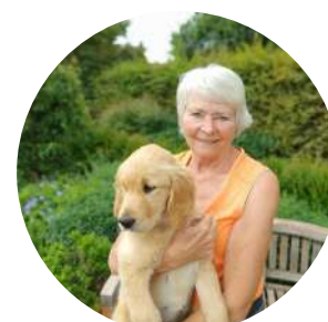
Xtra et Griet